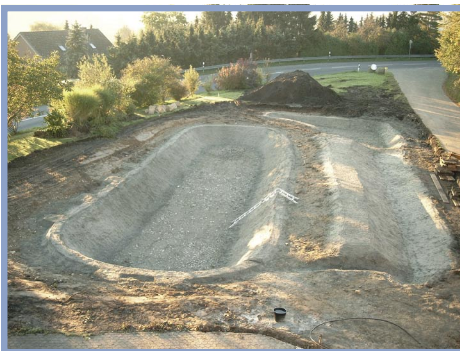
Zur Stabilisierung und Modellierung der Schwimmteichmulde stellte sich ein leichter Betonüberwurf als günstigste und stabilste Methode heraus, die auch gut vom Laien zu erstellen ist.

Den ersten Kontakt zu einem Schwimmteich hatten wir vor gut drei Jahren während eines Urlaubs in Kärnten. Dort besuchten wir ein öffentliches Naturschwimmbad und waren sofort begeistert – der Schwimmteich-Virus hatte uns erfasst, wir wollten mehr zu diesem Thema wissen. Es schien, als ob es eine Alternative zum Swimmingpool gab. Beim Studium der Lektüre wurde uns schnell klar, dass das Thema Schwimmteich noch ein recht junges Thema ist und dass es viele unterschiedliche Meinungen und Philosophien gibt. Mit Technik, ohne Technik, unterschiedliche Abdichtungssysteme, die Trennung von Schwimm- und Regenerationsbereich oder auch die Substratwahl: Methoden und Material waren von Anbieter zu Anbieter verschieden. Also suchten wir uns Anbieter von Schwimmteichen in der näheren Umgebung und ließen uns zunächst Referenzen nennen. Wir besuchten einige dieser Referenzanlagen und machten die Erfahrung, dass sich alle Schwimmteichbesitzer intensiv mit dem Thema auseinandergesetzt hatten und bereitwillig ihre ganz