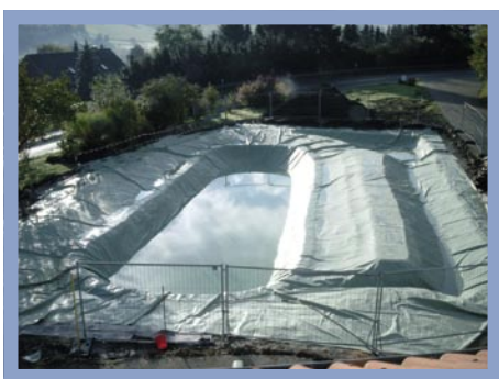
Mit der ausgebreiteten Dichtungsbahn lassen sich die einzelnen Zonen des Schwimmteiches gut voneinander unterscheiden.

persönlichen Entdeckungen weitergaben. Aus einer Literaturquelle erfuhren wir, dass es in einigen Bundesländern erforderlich ist, eine Baugenehmigung für einen Schwimmteich einzuholen. Die Rückfrage beim zuständigen Bauamt ergab, dass wir auf jeden Fall eine Baugenehmigung benötigten, da wir im Außenbereich wohnen, im Innenbereich sei dies erst ab einem Wasserinhalt von 100 m 3 erforderlich. Also nahmen wir Kontakt zu einem lokalen Gartenbauer auf, der auch schon einige Schwimmteiche gebaut hatte. Er erstellte uns eine erste Planung samt Zeich-