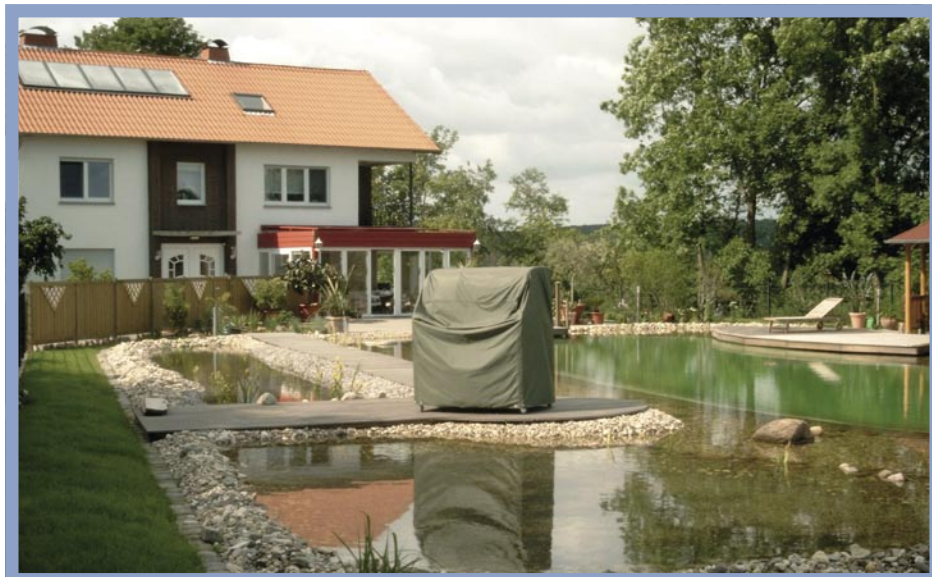
Ein Klavier am Schwimmteich?...