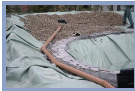
Die Rundskimmer und das Biocalith-Substrat für eine gute Wasserqualität sorgen.