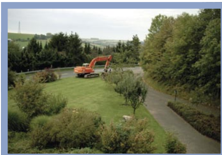
Ohne das richtige technische Equipment wird ein Schwimmteich in der Größe von Familie Ahle schnell zur Qual. Ein Bagger mit geübtem Fahrer erleichtert die anstrengende Arbeit des Aushubs.