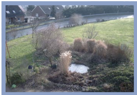
Die Faszination Wasser beginnt meist mit einem kleinen Gartenteich.