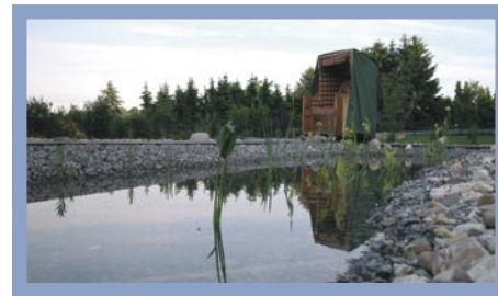
...Nein, es ist ein Strandkorb!

Die Pumpen drücken das Wasser in ein Drainagesystem, welches sich am Boden eines ca. 50 m 2 großen und 50 cm tiefen Kiesfilters befindet. Aus diesem Kiesfilter fließt das Wasser wieder in den Schwimmbereich, und der Kreislauf ist geschlossen. Für die Verrohrung haben wir 50 mm Rohr verklebt. Eine Pumpe mit einer Förderleistung von 8.000 Liter pro Stunde versorgt kontinuierlich den Kiesfilter, eine zweite Pumpe mit 12.000 Liter pro Stunde versorgt entweder den Kiesfilter oder einen Quellstein. Das System ist so ausgelegt, dass der Wasserinhalt circa einmal pro Tag umgewälzt und der Kiesfilter mit max. 0,5 Meter pro Stunde vertikal durchströmt wird.