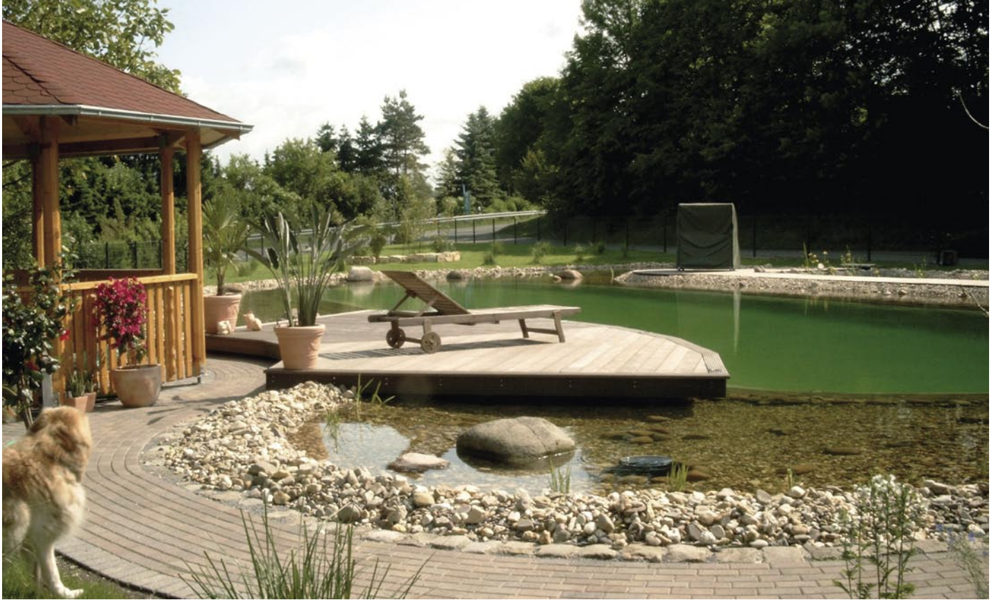
Geschafft: Die fertige Anlage mit der Reinigungszone im Vordergrund, vom Schwimmbereich durch die Steganlage getrennt. Dahinter der Schwimmbereich mit der Holzterrasse und dem Pavillion.

Große Sorgfalt verwendeten wir auf die Randgestaltung. Als Kapillarsperre haben wir rings um den Teich einen Rasenkantenstein in Beton gesetzt. Diese wurden mit Hilfe des Lasers genau auf Höhe gesetzt und stellen eine dauerhafte Begrenzung dar. Hierüber wurde die Folie gezogen und mit Kies abgedeckt. Als Abschluss setzten wir eine Reihe Pflastersteine. Hierbei handelt es sich um sogenannte Gossensteine, die ich an einem Samstag zufällig in den Kleinanzeigen der lokalen Zeitung fand. Dass der Verkäufer auch noch zehn große Findlinge für € 100,- abgeben woll-