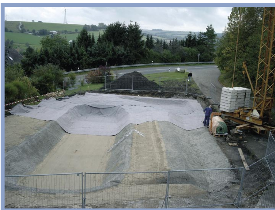
Als Schutz der Dichtungsbahn liegt eine Schutzlage aus Geovlies, das mit einer Überlappung von 5-10 cm relativ schnell zu verlegen ist.