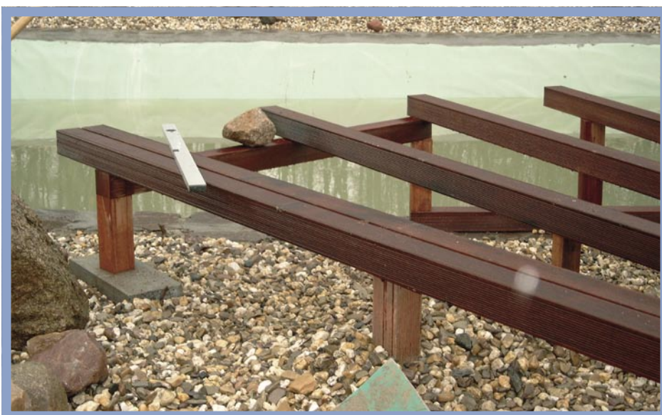
Die Verarbeitung der Bankirai-Bohlen und Bretter war durch das Vorbohren und Senken deutlich aufwendiger als geplant.