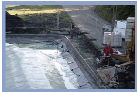
Die Kapillarsperre besteht aus Rasenkantensteinen in einem Betonfundament, bei dessen Herstellung der Kran mit der Betonbombe eine große Hilfe war.