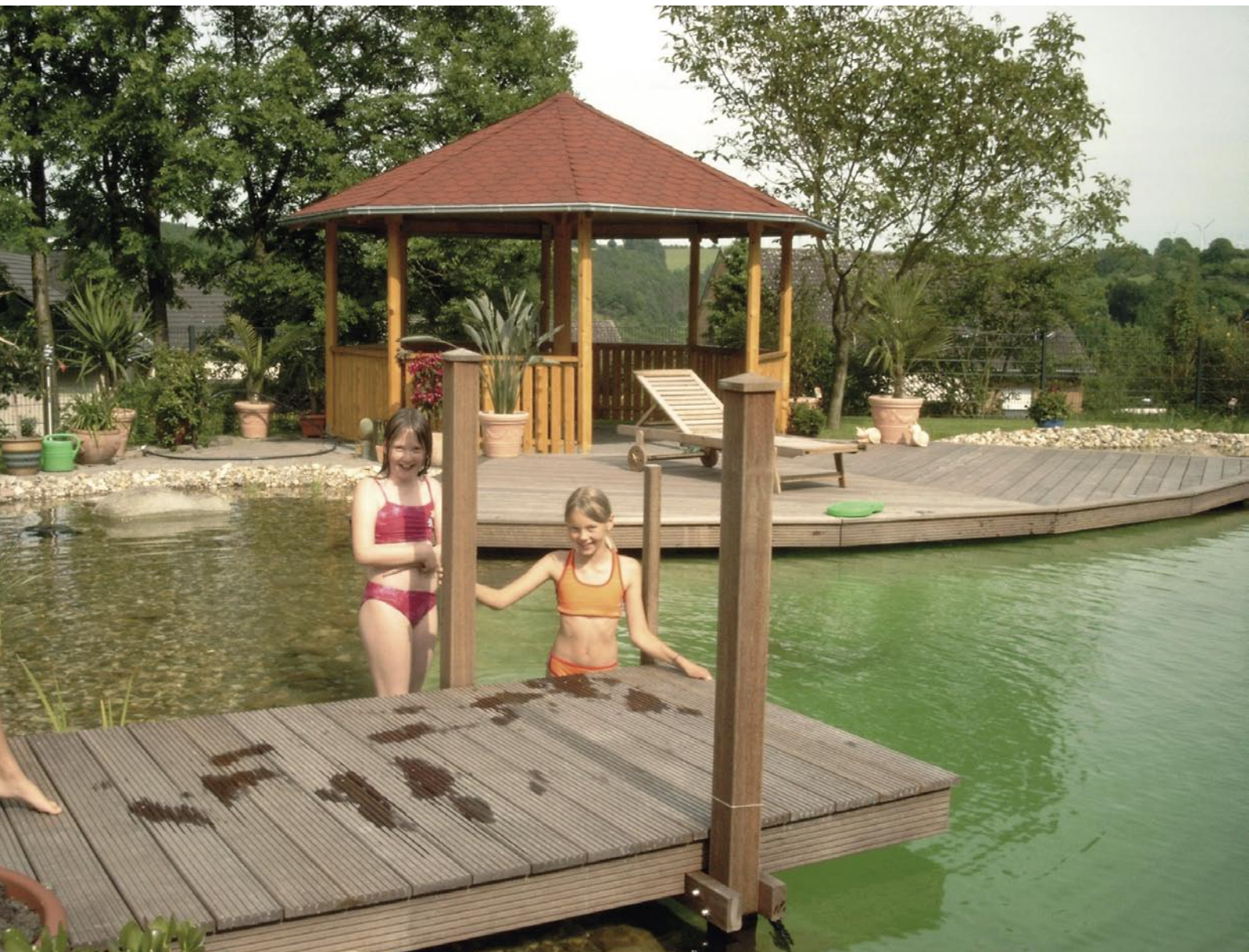
Wohnraum Schwimmteich: „Warum fährt ihr eigentlich noch in Urlaub?“ – eine häufig gestellte Frage an Schwimmteichbesitzer.

Auf den Wall brachten wir einen Streifen Vlies auf und klebten darauf mit Trasszement Porphyrlatten, die wir für € 10,- pro m 2 im Baumarkt erworben hatten. Die Abtrennung zwischen Schwimm- und Regenerationsbereich war fertig.