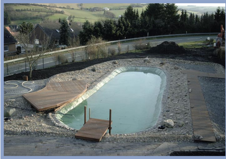
Fast fertig: Schwimm- und Reinigungsbereich, Holzterrasse und Stege sind fertig, fehlt nur noch das Wasser.

Bekanntes lag die 1,5 Tonnen schwere Folie innerhalb von einer Stunde an Ort und Stelle. Bei dieser Vorgehensweise muss man akzeptieren, dass sich in den Rundungen einige Falten bilden. Dies ist aus unserer Sicht jedoch akzeptabel. Wer dies vermeiden möchte, muss die Folie vor Ort verschweißen. Hierzu würden wir jedoch auf jeden Fall einen Fachmann hinzuziehen, da eine qualitativ hochwertige Schweißnaht einige Übung erfordert. Es gibt Folienanbieter, die diesen Service anbieten.