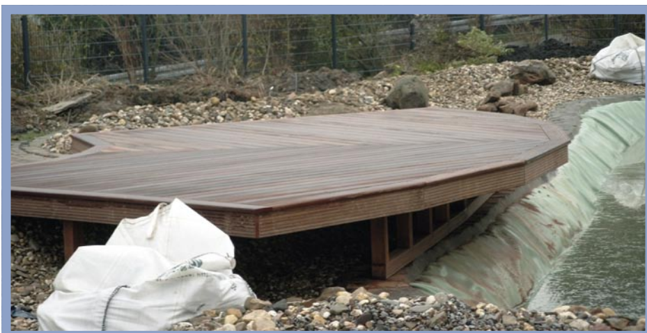
Die fertige Holzterrasse jedoch war die Mühe wert.

einander getrennt werden sollten. Eine gegossene Betonwanne kam nicht in Frage, da wir sie nicht selbst erstellen konnten, sie zu teuer und letztendlich für einen Schwimmteich in seiner eigentlichen Form unnatürlich ist. Lange hatten wir den Einsatz von Lärchenholzstämmen favorisiert, und die Stämme beim lokalen Förster reserviert. Auch hatten wir ein Sägewerk im Nachbarort gefunden, das uns die Stämme zugeschnitten hätte. Ein Besuch auf der Internetseite Schwimmteich-Selbstbau.de brachte uns jedoch auf eine andere Idee.