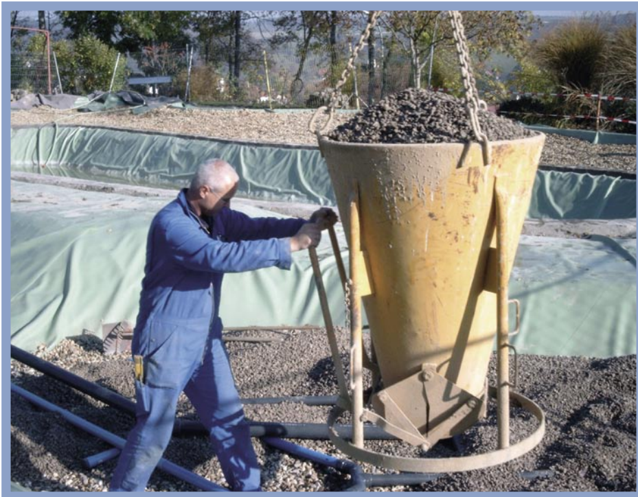
Das Filtersubstrat lässt sich ohne großen Aufwand mit der Betonbombe verteilen. Voraussetzung ist, dass man in einen Kran investiert und den nötigen Platz zum Aufstellen hat.