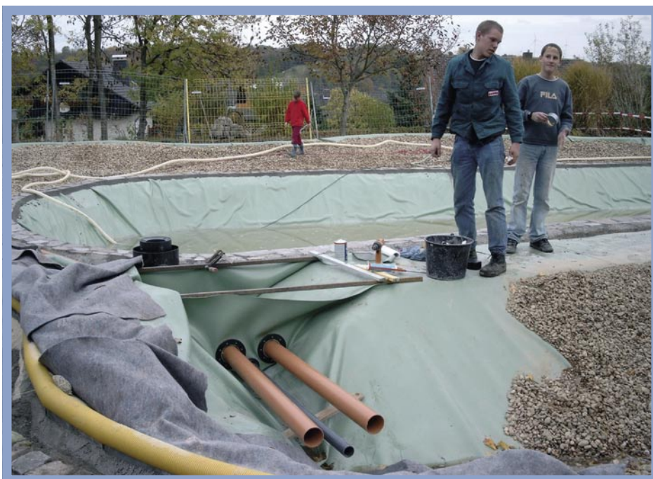
Die Verbindung der einzelnen Beckenbereiche stellten KG-Rohre sicher, die durch eine Fest-Los-Flanschtechnik in die Dichtungsbahn eingebunden wurden.

Da wir für die erstellte Planung eine Gebühr bezahlt hatten, sahen wir uns nicht an den erstkontaktierten Gartenbauer gebunden. Also ließen wir uns zwei weitere Angebote von Schwimmteichanbietern erstellen, die jeweils einem Systemanbieter angeschlossen sind. Die angebotenen Preise waren jedoch ein Schock für uns und einige Monate lag das Thema Schwimmteich auf Eis – obwohl es Sommer war. Bei Preisen von über € 350,- pro m 2 Wasseroberfläche schien unser Traum vom Schwimmteich ausgeträumt.