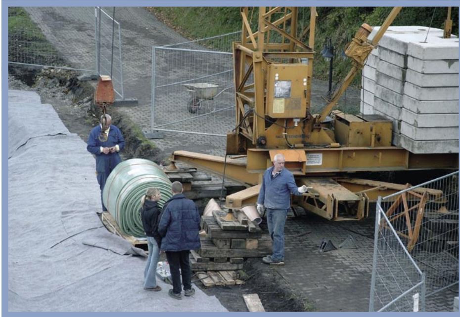
Die Dichtungsbahn lässt sich aufgrund ihres Gewichts nur mit Hilfe eines Krans ausbringen. Dann allerdings ist die Arbeit, mit ausreichend Hilfskräften, fast ein Kinderspiel.